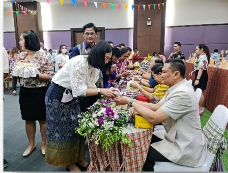
ร่วมงานรดน้ำคำหัวผู้ใหญ่ของ กรมสนับสนุนบริการสุขภาพ