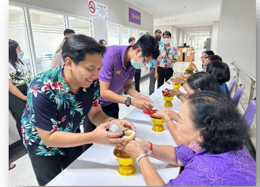
จัดงานรดน้ำคำหัวผู้ใหญ่ภายใน กลุ่มแผนงาน ตามวัฒนธรรม และประเพณี