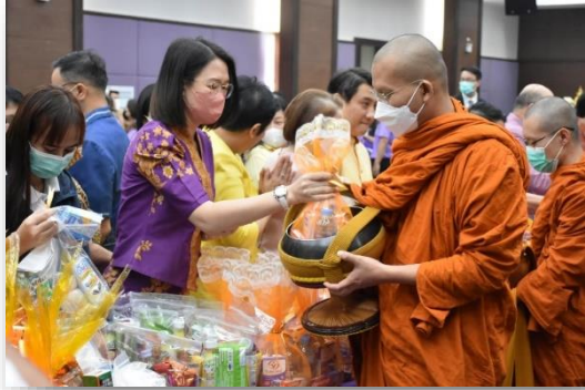
ร่วมงานทำบุญปีใหม่ของ กรมสนับสนุนบริการสุขภาพ